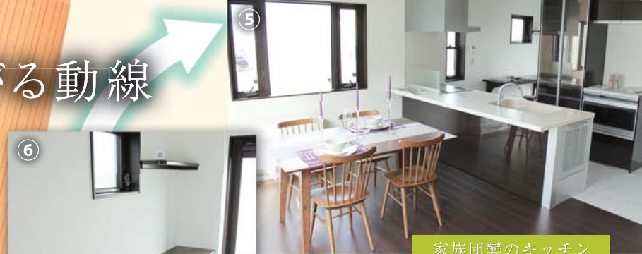
家族団樂のキッチン 多機能な収納はもちろん、家族の様子を見ながら、会話や料理をすることができます。