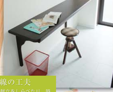
動線の工夫 パソコンで献立をしらべたり、時には、アイロンがけなど日頃の家事をしやすくなる空間。