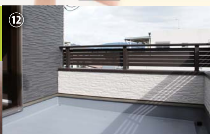
プライベートスペース 2F広々バルコニーで人目を気にすることなく、読書やお茶を楽しめます。休日に家族でランチでも。