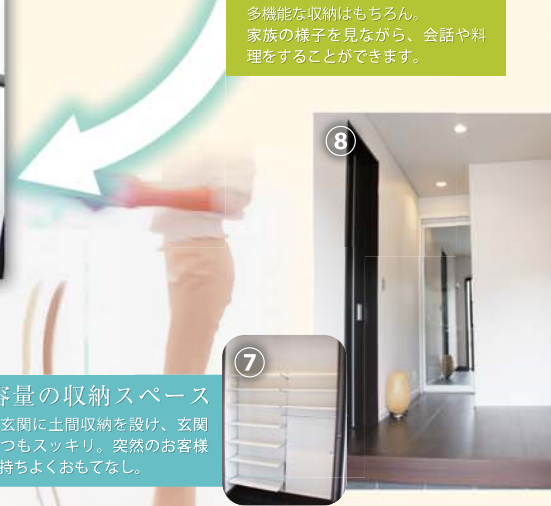
大容量の収納スペース 家族玄関に土間収納を設け、玄関はいつもスッキリ。突然のお客様を気持ちよくおもてなし。